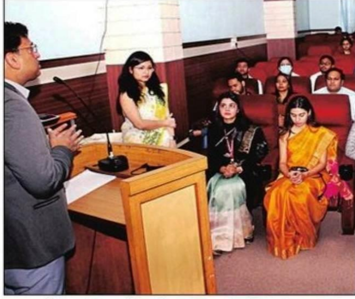
आईटीएस डेंटल कॉलेज में कार्यशाला में मौजूद लोग। संवाद